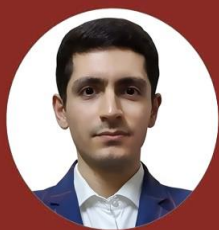
نویسنده: امید فدوی